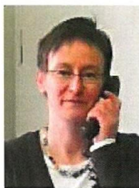
Verwaltung: Karin Drimalski

Sollten Sie nähere Informationen zum Förderverein, zur Anmietung oder Besichtigung des Gemeinschaftshauses Wustrow wünschen, wenden Sie sich bitte an: