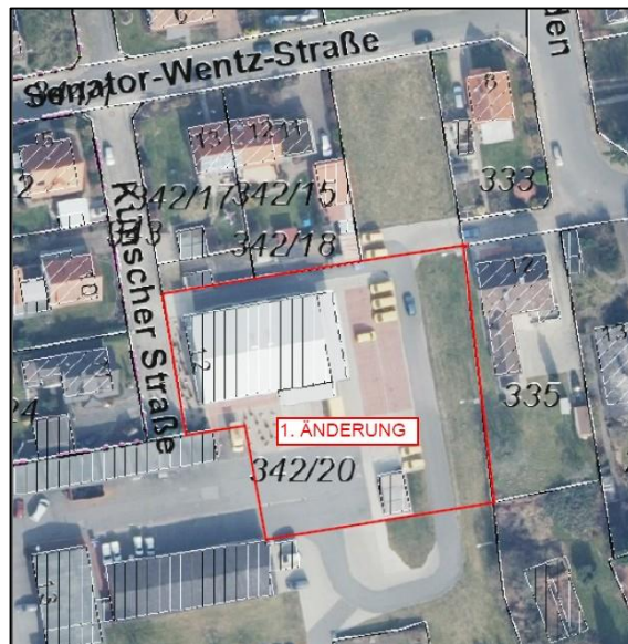
FLURSTÜCKSKATASTER MIT LUFTBILD MIT ROT UMRANDETER MARKIERUNG DES GELTUNGSBEREICHES DER 1. ÄNDERUNG