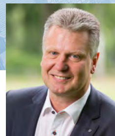
Torsten Petersen Bürgermeister der Stadt Lüchow (Wendland)